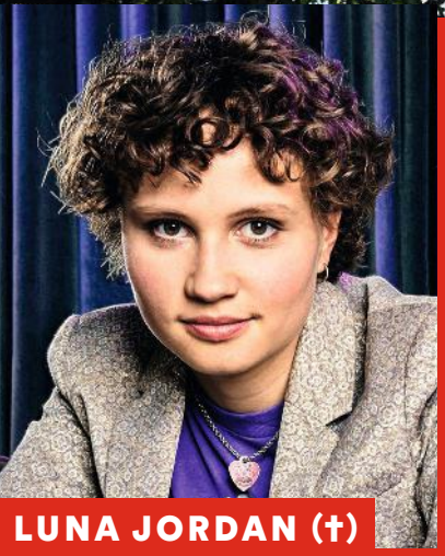
LUNA JORDAN (+)

Exklusiv EMILY BLUNT Liebe kann auch zerstören