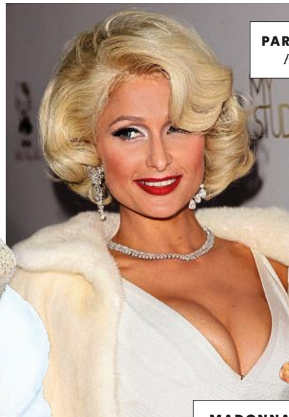
PARIS HILTON Hotelerbin

Bei der Met Gala 2022 trug der Reality-TV-Star eines der berühmtesten Kleider der Welt: das Monroe-Original. Der Auftritt brachte Kim Kardashian viel Kritik ein