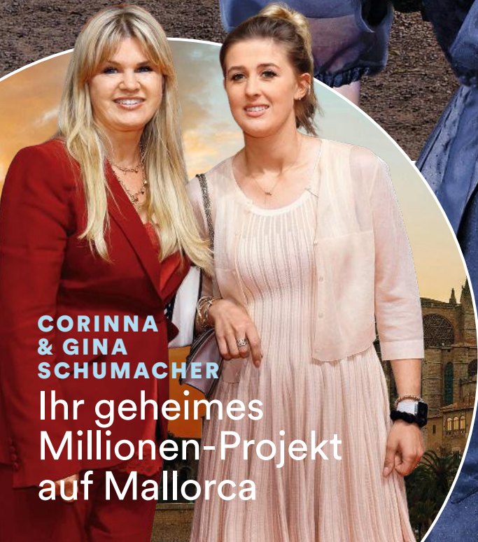
CORINNA & GINA SCHUMACHER

Ihr geheimes Millionen-Projekt auf Mallorca