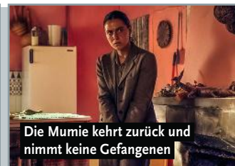
Die Mumie kehrt zurück und nimmt keine Gefangenen