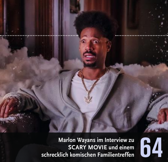
Marlon Wayans im Interview zu SCARY MOVIE und einem schrecklich komischen Familientreffen