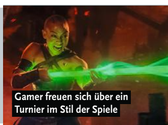
Gamer freuen sich über ein Turnier im Stil der Spiele

»Spricht sowohl nostalgische Fans als auch Newcomer an« ■■■■□□