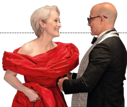
Miranda Priestly (Meryl Streep) und Nigel (Stanley Tucci) freuen sich über ihr gelungenes Comeback