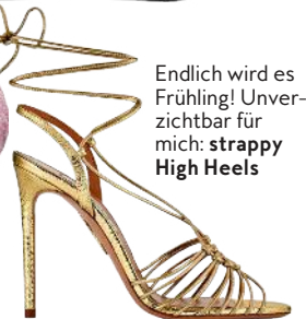
Endlich wird es Frühling! Unver- zichtbar für mich: strappy High Heels