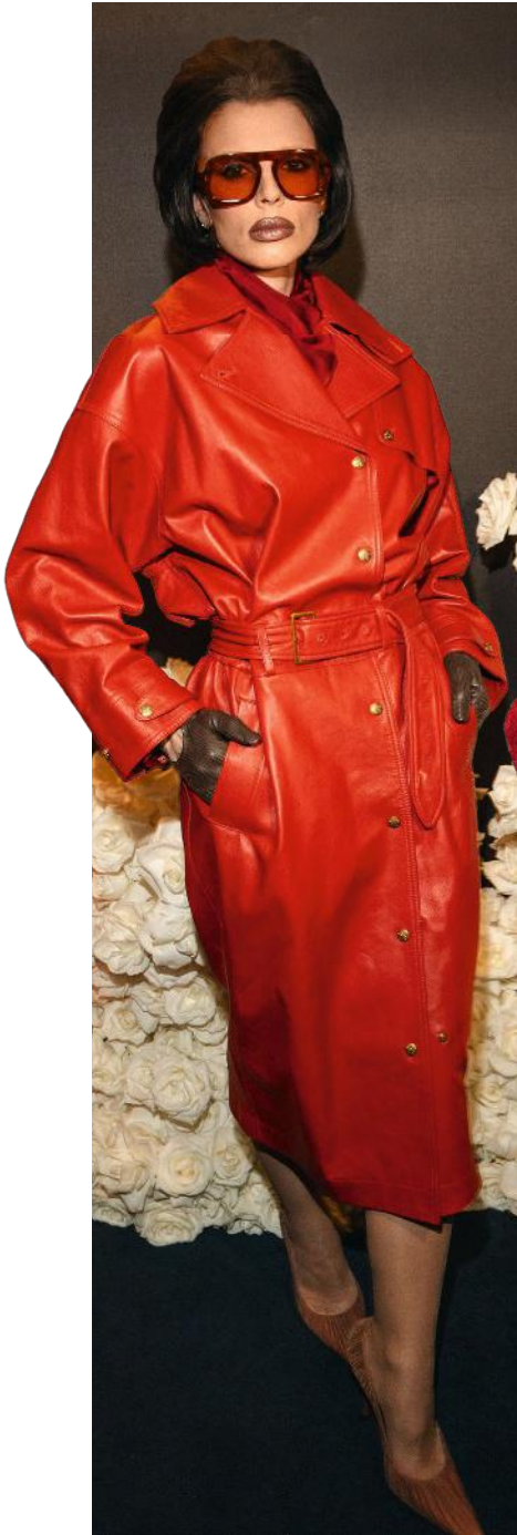
Stilkone und Autorin Julia Fox („Down the Drain“) in einem Full Look von Willy Chavarria