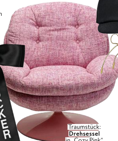
Traumstück: Drehsessel in „Cozy Pink“