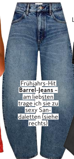
Frühjahrs-Hit Barrel-Jeans - am liebsten trage ich sie zu sexy Sandaletten (siehe rechts)

Ich liebe das L.A.- Label Mother , dessen Accessoires (hier eine Haarspange) einen immer zum Schmünzeln bringen